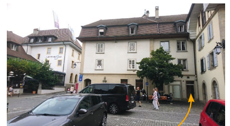
Entrée du Centre de Jeune