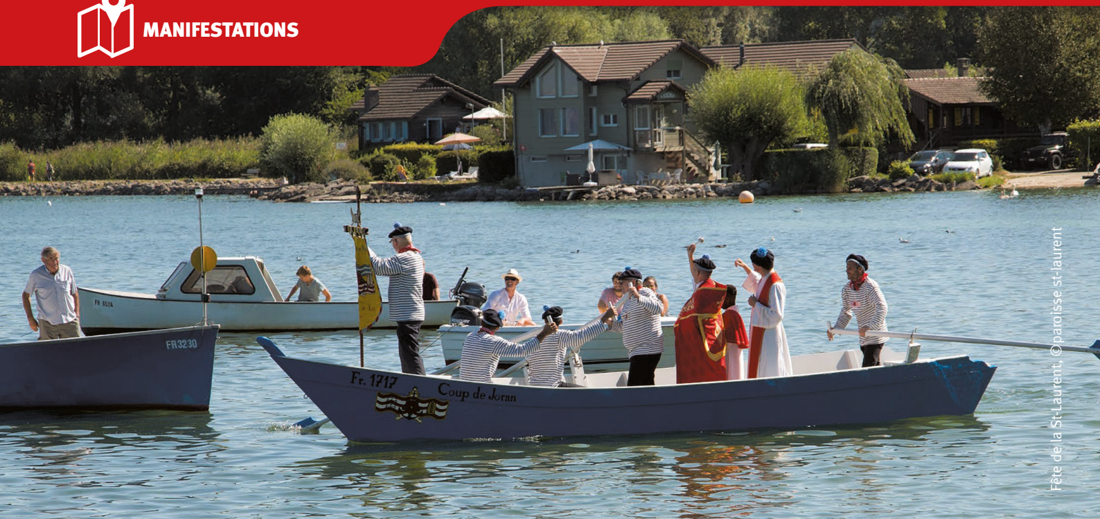
Fête de la St-Laurent

Sous réserve d'annulation pour cause de COVID-19